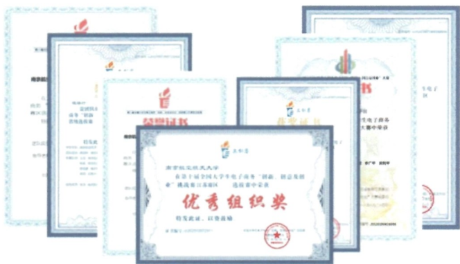
图3 全国大学生电子商务“创新、创意及创业”挑战赛获奖证书（节选）