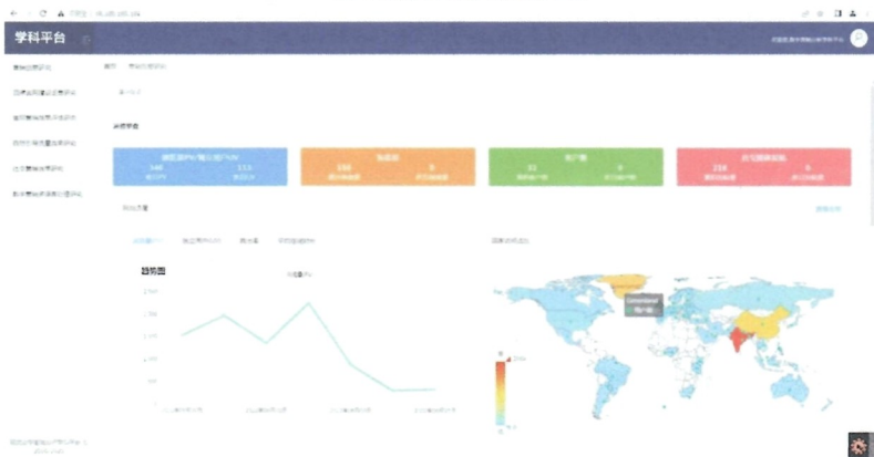
图5 数字营销分析研究平台后台界面