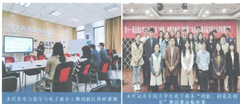
图1 未迟-南航校企合作

与南航经济与管理学院共建电子商务主题创新区，深度参与研究生科研课题、学科竞赛的组织与实施（见图1）。企业导师与高校教师共同指导学生课题研究，近三年共发布和执行了38项科创项目，累计吸引156名同学参与，在高水平期刊与会议上发表20余篇论文（见图2）；未迟连续多年赞助经管学院电子商务主题创新区承办全国大学生电子商务“创新、创意及创业”挑战赛南航校赛，选拔的优秀队伍多次斩获国家级、省级奖项：获国赛二等奖1名；省赛一等奖4名、二等奖7名、三等奖12名；多次获评优秀组织奖（见图3）。