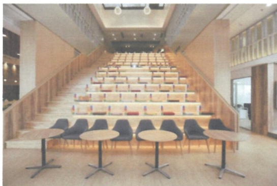
图 7 日常交流实践场地

定期不定期组织培训、专题技术交流会、典型企业和成功企业经验分享等活动，实现海外营销技术的培训与交流，搭建专业交流平台。