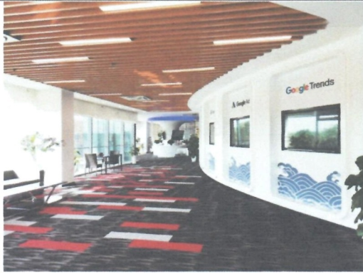
图 8 出海技术体验区 (部分)