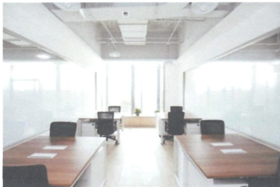
图 6 日常研究实践场地

的场地，能够高效链接全球顶尖数字营销技术、优势产品和媒体资源，提供专业领域实践。