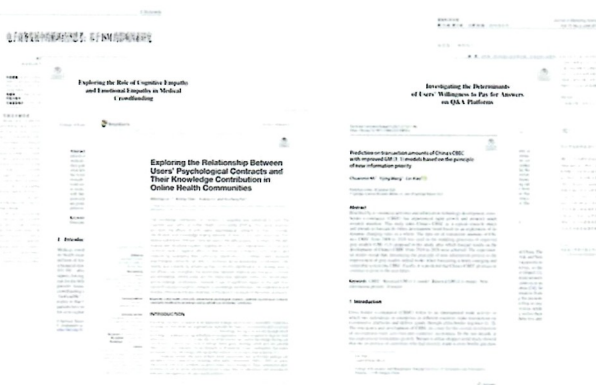
图2 电子商务主题创新区发表论文（节选）